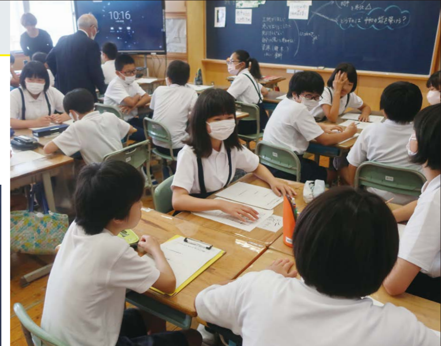
心の中に平和の砦を築く・話し合い