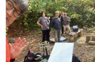
新湯3 Starlink 接続実証の様子