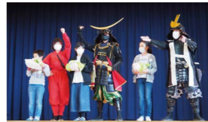
伊達武将隊による種の贈呈