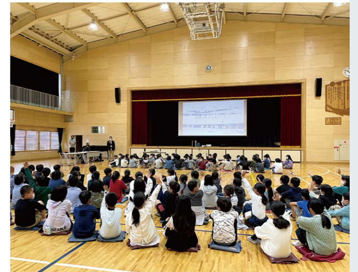
体育館でみんなで学習